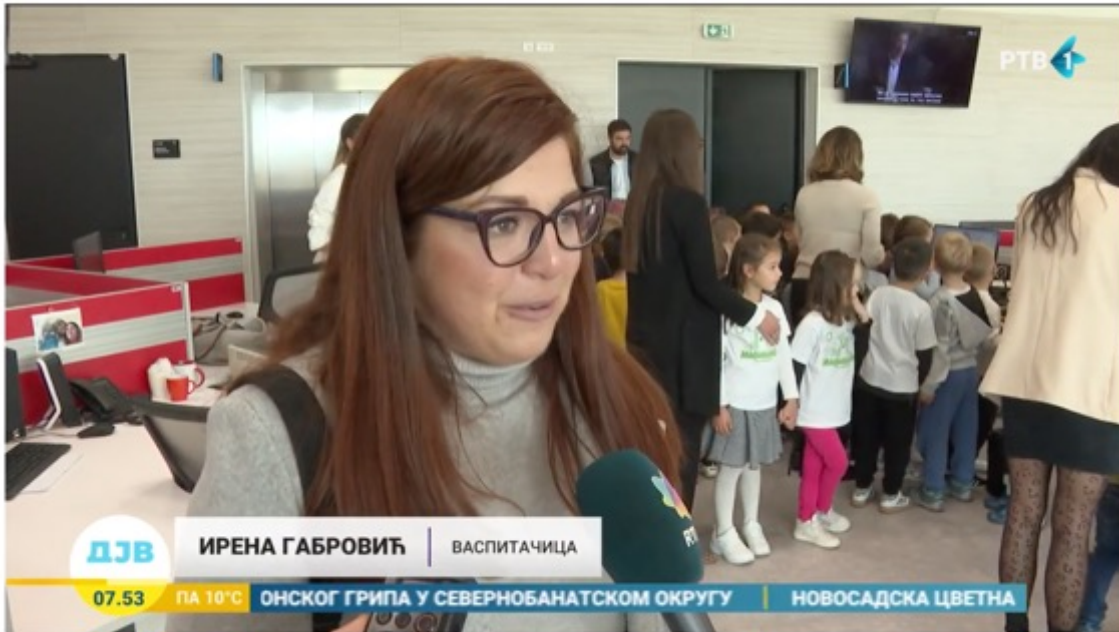
Predškolci upoznali jutarnji program RTV-a iza kamera

https://www.youtube.com/watch?v=A5eKP0RiHfg