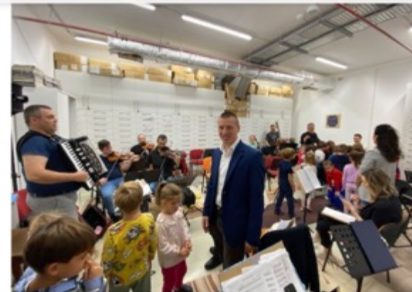
studio. Na kraju će imati priliku da pogledaju predpremieru nove dječje emisije "Oka Kekine avanture", koja će se uskoro emitovati na Prvom programu RTV-a.