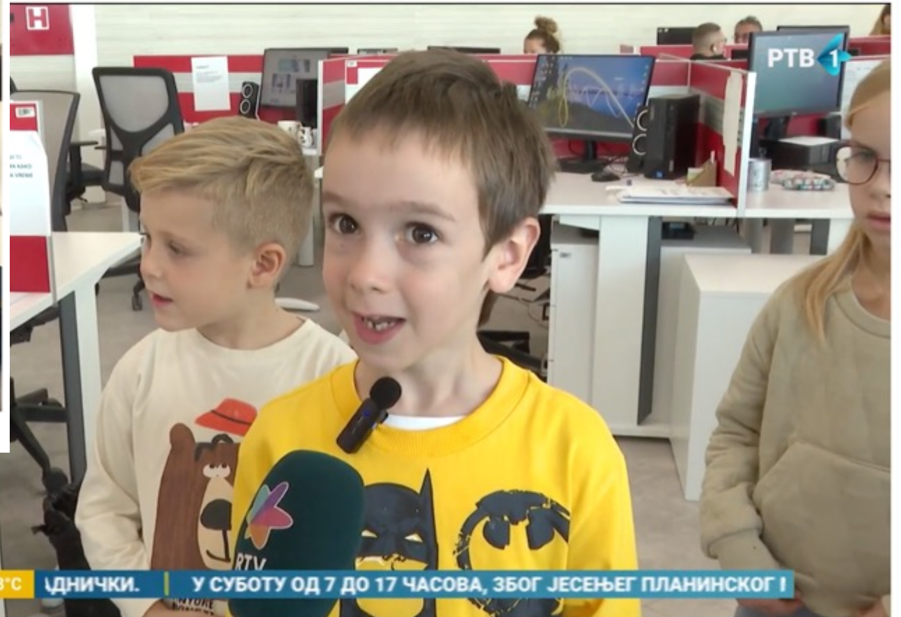
Predškolci upoznali jutarnji program RTV-a iza kamera