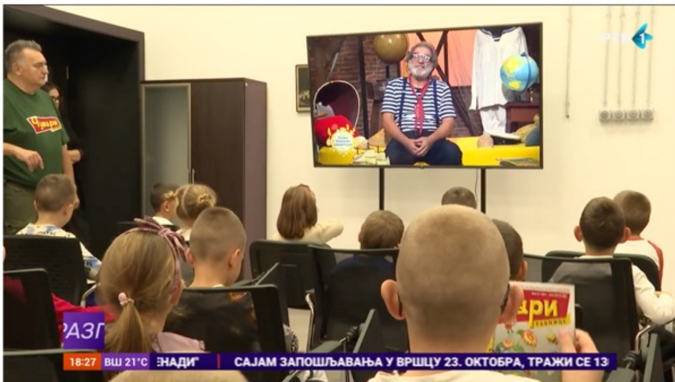
Otvoreni dani medijske pismenosti za decu počinju u RTV-u

https://www.youtube.com/watch?v=AkkcMAhblls